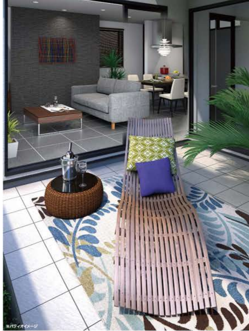
※パティオイメージ

シンプルでキュービックなエクステリアが印象的なT-styleCUBE。視線のハイライトとなるアクセントウォールには耐久性と美観に優れたタイル外壁を採用。コントラストをきかせたカラーリングと種類の異なる外壁素材の組み合わせが、クリーンで都会的な佇まいを演出します。